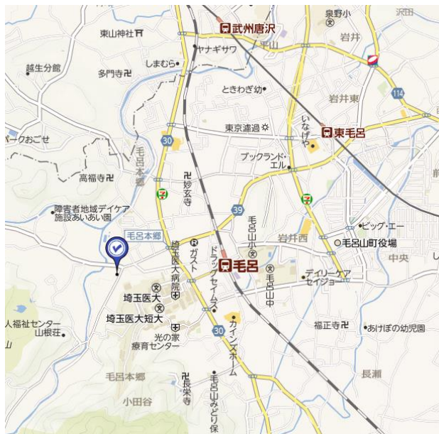
◎毛呂駅より徒歩 8 分（約 800m）