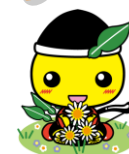
毛呂山町マスコットキャラクター もろ丸くん